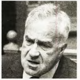
Η προτροπή Βορίδη για παρεμβάσεις στο κράτος και στους θεσμούς ώστε να μην ξαναέρθει η Αριστερά στην εξουσία δεν χαρακτηρίστηκε ως συνταγματική εκτροπή