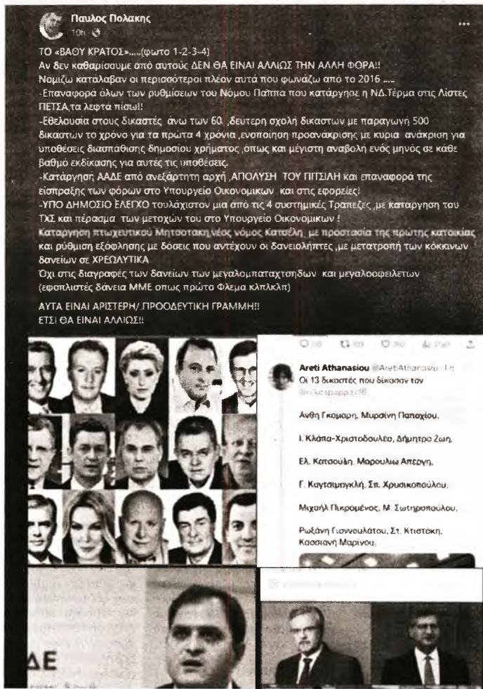
Η τελευταία ανάρτηση του Παύλου Πολάκη στο Facebook που προκάλεσε θύελλα αντιδράσεων και οδήγησε στην απονομή του από τη θέση του αναπληρωτή τομεάρχη Διαφάνειας του ΣΥΡΙΖΑ

Ας θυμηθούμε ορισμένες από αυτές τις περιπτώσεις την τελευταία 4ετία: ● Τον Απρίλιο του 2019 κι ενώ η Ν.Δ. είναι στριμωγμένη, καθώς ο Κυριάκος Μητσοτάκης έχει προαναγγείλει το κόψιμο των επιδομάτων της κυβέρνησης ΣΥΡΙΖΑ (άσχετα αν πολιτεύεται με αυτά σήμερα), με μια ανάρτησή του επιτίθεται στον υποψήφιο ευρωβουλευτή της Ν.Δ. Στέλιο Κυ-