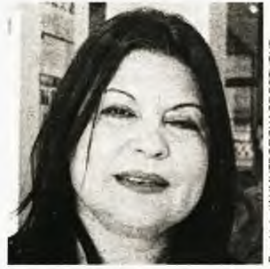
Σοκαριστική χαρακτηρισία την ανάρτηση Πολάκη η πρόεδρος της Ένωσης Δικαστών και Εισαγγελέων, Μαργαρίτα Στενιώτη

Η ίδια η πρόεδρος της Ένωσης Δικαστών και Εισαγγελέων, Μαργαρίτα Στενιώτη, μιλώντας σε κανάλι δήλωσε ότι «δεν είναι η πρώτη φορά που [ο Πολάκης] στοχοποιεί τη Δικαιοσύνη, ωστόσο η συγκεκριμένη ανάρτηση είναι σοκαριστική. Η φράση "Αν δεν καθαρίσουμε με αυτούς" και η λίστα ονομάτων συνιστά εκτροπή από τη συνταγματική νομιμότητα» και συμπλήρωσε: «Δεν είναι μόνο έλλειψη σεβασμού στην αρχή του κράτους δικαίου, αλλά ένα βαρύτατο πλήγμα στο δημοκρατικό πολίτευμα. Είναι συνταγματική εκτροπή από πρώην υπουργό, νυν βουλευτή και στέλεχος της αξιωματικής αντιπολίτευσης». Η κ. Στενιώτη, βέβαια, είχε κάνει λόγο για συνταγματική εκτροπή και με αφορμή τις παρακολουθήσεις,