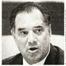
Ο Αδωνης Γεωργιάδης έχει κατ'επανάληψη «κρεμάσει στα ματθόκια» δικαστικούς και δημοσιογράφους χωρίς βέβαια καμία εισαγγελική παρέμβαση εναντίον του