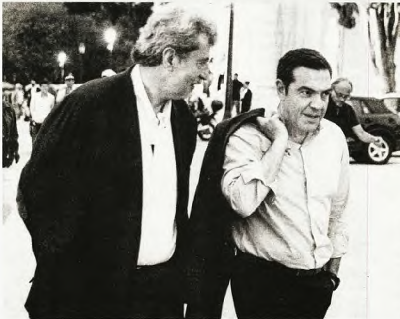
Μέχρι χθες το βράδυ δεν είχε υπάρξει απευθείας επικοινωνία του Αλέξη Τσίπρα με τον Παύλο Πολάκη

Το σκηνικό έμοιαζε να είναι επανάλυση εκείνου μίας εβδομάδας πριν, όταν μετά την ανακοί-