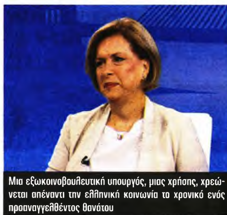
Μια εξωκοινοβουλευτική υπουργός, μιας χρήσης, χρεώνεται απέναντι την ελληνική κοινωνία το χρονικό ενός προαναγγελθέντος θανάτου