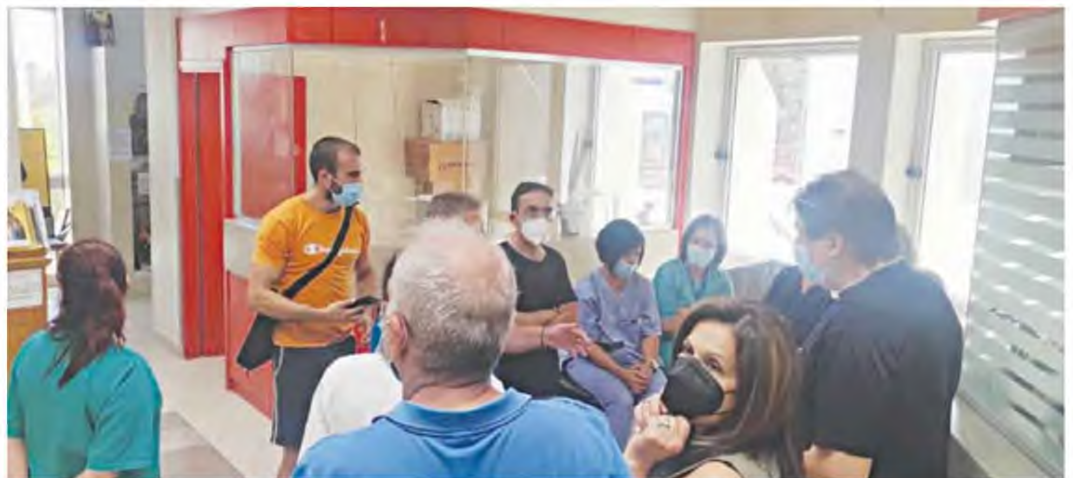
Στιγμιότυπο από τη χθεσινή κινητοποίηση των εργαζομένων στο ΠΑΓΝΗ.