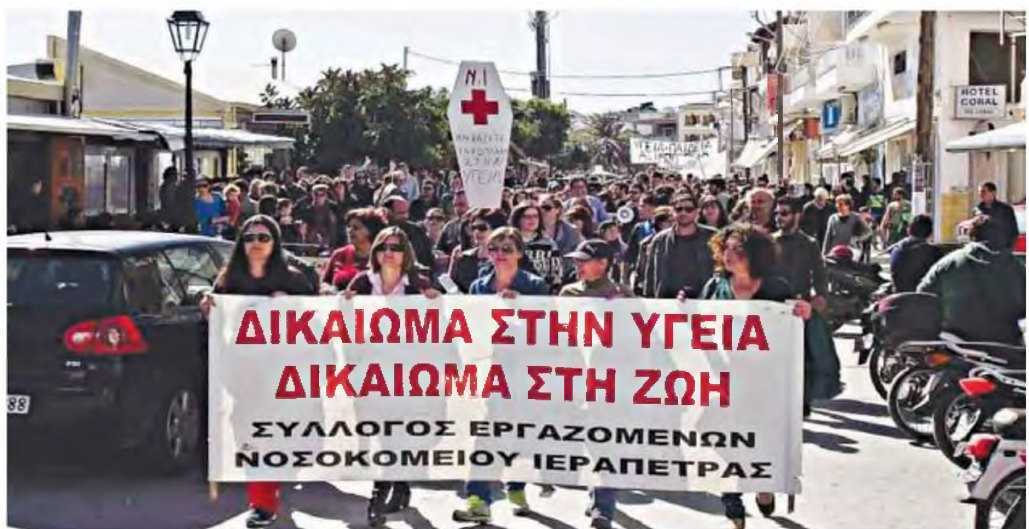
Συγκέντρωση διαμαρτυρίας πραγματοποιούν την ερχόμενη Δευτέρα, στις 11 το πρωί, έξω από την είσοδο του νοσοκομείου οι εργαζόμενοι του ιδρύματος.

■ Δυναμικές κινητοποιήσεις με φόντο τη διαρκή υποβάθμιση του νοσηλευτικού ιδρύματος της πόλης τους ετοιμάζουν οι Ιεραπετριτές