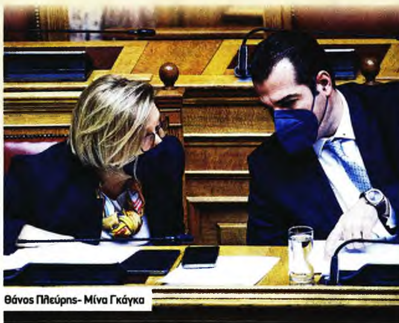
Θάνος Πλεύρης- Μίνα Γκάγκα

Κυβερνητική αδιαφορία προκύπτει από το πόρισμα του Ελεγκτικού Συνεδρίου που παραδόθηκε στον Θάνο Πλεύρη και στην Ασημίνα Γκάγκα, αναφορικά με την ετοιμότητα των δημόσιων νοσοκομείων για την αυξημένη ζήτηση κλινών Εντατικής Θεραπείας το 2020 εξαιτίας της πανδημίας.