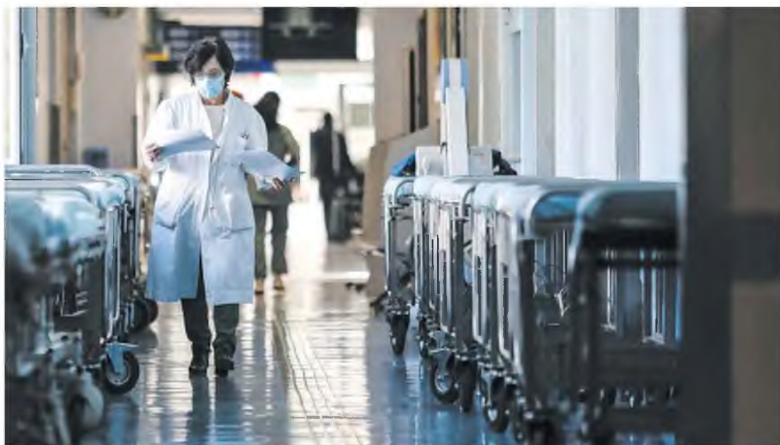
Ο αριθμός νέων ημερήσιων εισαγωγών ασθενών με COVID-19 στα νοσοκομεία έχει υποχωρήσει σε επίπεδα κάτω των 400, όταν το διάστημα από τα μέσα Μαρτίου έως και τις 20 Απριλίου ήταν γύρω στις 500.

Με βάση τα στοιχεία του ΕΚΑΒ και του ΕΟΔΥ, για καθενιά από τις πρώτες δέκα ημέρες του Μαΐου, οι νέες εισαγωγές στα νοσοκομεία δεν έχουν ξεπεράσει τις 400, όταν το διάστημα από τα μέσα Μαρτίου έως και τις 20 Απριλίου ήταν γύρω στις 500, ενώ υπήρχαν και ημέρες που είχαν ξεπεράσει τις 550. Από τις αρχές Μαΐου ο αριθμός των εισαγωγών ασθενών με COVID-19 στα νοσοκομεία είναι ίδιος ή και μικρότερος από τον αριθμό των εξιτηρίων που εκδίδονται. Είναι ενδεικτικό ότι την εβδομάδα 26 Απριλίου με 2 Μαΐου, ο λόγος εισαγωγών νέων ασθενών προς εξιτήρια λόγω ίασης ήταν 1 (3.018 εισαγωγές και 3.016 εξιτήρια), για πρώτη φορά μετά τον Ιανουάριο, ενώ χθες εκδόθηκαν 67 εξιτήρια περισσότερα από τις εισαγωγές. Αξίζει να σημειωθεί ότι ένα μήνα πριν και συγκεκριμένα το διάστημα 5-11 Απριλίου –όταν και κορυφώθηκε η πίεση στο ΕΣΥ από την πανδημία–, οι εισαγωγές νέων ασθενών ήταν 3.707 και το σύνολο των εξιτηρίων λόγω ίασης 2.987 (λόγος εισαγωγών προς εξιτήρια 1,24). Η δε κάλυψη των απλών κλινών COVID των νοσοκομείων είναι πλέον στο 47% και των κλινών ΜΕΘ COVID στο 77,5%, στο σύνολο της επικράτειας. Σε αυτό