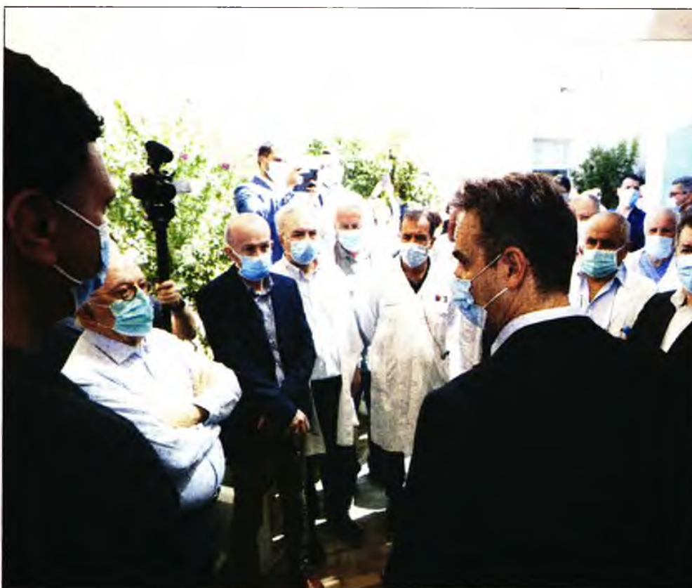
Ο πρωθυπουργός Κυριάκος Μητσοτάκης σε επίσκεψή του στο Νοσοκομείο Σαντορίνης, λίγες ώρες πριν από το άνοιγμα της τουριστικής σεζόν 2020

παρουσιάζει η ΠΟΕΔΗΝ , το εμβολιαστικό κέντρο του νοσοκομείου Σαντορίνης και το τμήμα επειγόντων περιστατικών, μαζί με τη διαλογή περιστατικών κορονοϊού καλύπτονται μόνο από έναν γενικό γιατρό που μεταφέρθηκε από το Κέντρο Υγείας που έκλεισε, ο οποίος δεν λαμβάνει το επίδομα ευθύνης, όπως και οι άλλοι γιατροί που μεταφέρθηκαν από το Κέντρο Υγείας.