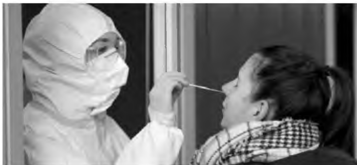
Τα κρούσματα χθες ήταν και πάλι αυξημένα, καθώς ανακοινώθηκαν 48 νέες μολύνσεις στην Περιφερειακή Ενότητα Μαγνησίας, ενώ καταγράφεται αύξηση κατά 21% του ικού φορτίου στα λύματα

Οι νεκροί από κορονοϊό ανέρχονται σε 246 από τις 19 Οκτωβρίου στο Αχιλλοπούλειο, ενώ άλλα οκτώ άτομα πέθαναν σίπια τους ή σε άλλα Νοσο-