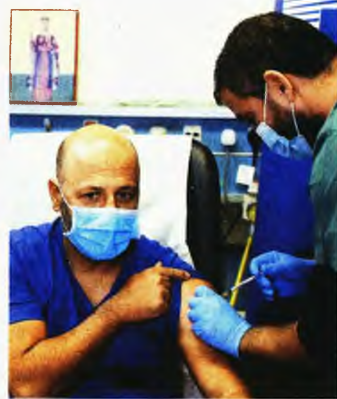
Μέλος ιατρικού και νοσηλευτικού προσωπικού εμβολιάζεται για τον κορωνοϊό στο Κεντρικό Νοσοκομείο Αμμοχώστου στη Δερύνεια της Κύπρου

Η Ευρώπη και πάλι δεν είναι στα καλύτερά της. Όπως και ολόκληρος ο κόσμος, μιας και οι πιο πολλές κυβερνήσεις έχουν αποδυθεί σε αγώνα δρόμου για να «καταρώσουν» όσο περισσότερες δόσεις μπορούν, αδιαφορώντας για τις εκκλίσεις ΟΗΕ, ΠΟΥ και υγειονομικών για ίση και δίκαιη μεταχείριση.