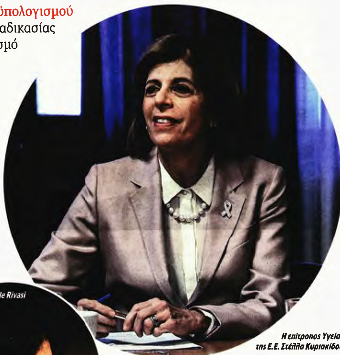
Η επιτροπος Υγείας της Ε.Ε. Στέλλα Κυριακίδου

Την αρχή έκανε η βουλευτής των Πρασίνων, Michele Rivasi: «Μας λέτε ότι πρέπει να καταπολεμήσουμε την παρα-