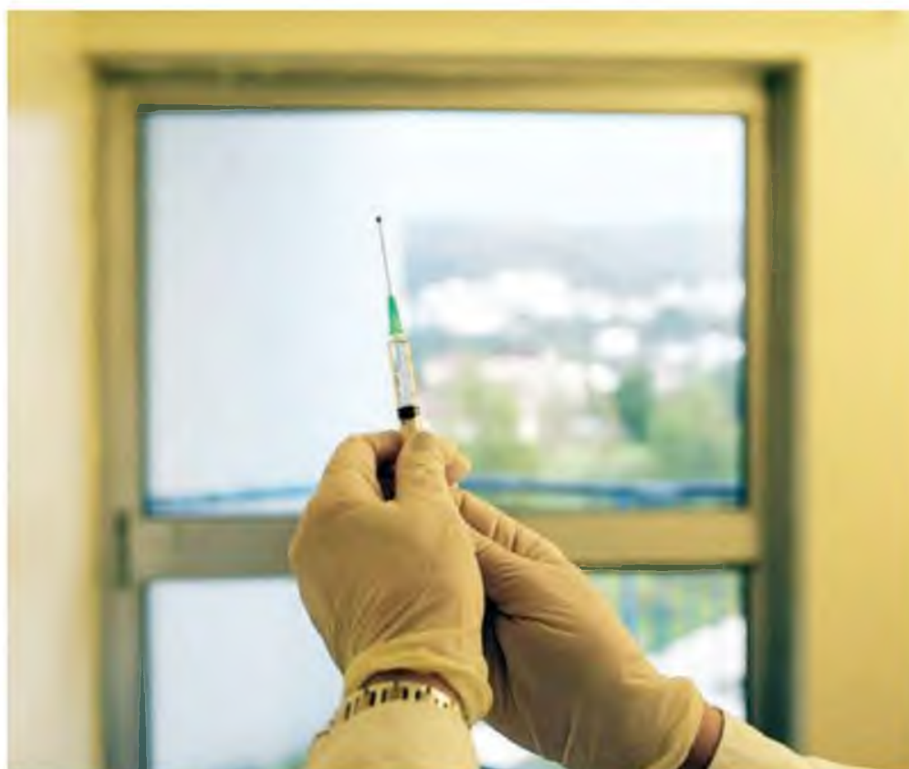
Μέχρι Τετάρτη ξεκινούν οι εμβολιασμοί και στο Γηροκομείο Βόλου

Ο ομιλητής αφού ενημέρωσε το προσωπικό για τον εμβολιασμό, δέχτηκε και απάντησε σε ερωτήσεις του