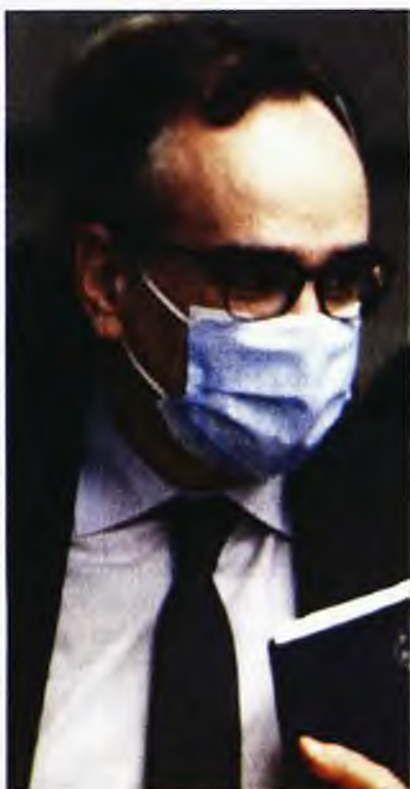
Ο αναπληρωτής υπουργός Υγείας Βασίλης Κοντοζαμάνης

Μ ετά τα υποκριτικά χειροκροτήματα από τα κυβερνητικά μπαλκόνια, η κυβέρνηση παραδίδει τώρα τους ήρωες της πρώτης γραμμής, γιατρούς και νοσηλευτές, στη δημόσια χλεύη, αντιμέτωπους ακόμα και με δικαστικές διώξεις!