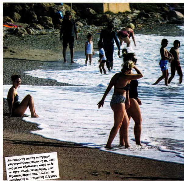
Καλοκαιρινές εσπέρας κατέγραψε ο φορέας στις παραλίες της Αττικής, με τον ήλιο να καίει και η θάλασσα να περιπατάει, αλλά και περισσότερους αυταννομους ελεγχους

«Αυτό θα είναι η αρχή του τρίτου κύματος το οποίο, αν το αφήσουμε να εξελιχθεί, τέλος Μαρτίου θα βλέπουμε την κορύφωση» τόνισε ο κ. Σαρηγιάννης και πρόσθεσε πως θα πάμε καλά αν μείνουν ανοικτά μόνο τα δημοτικά.