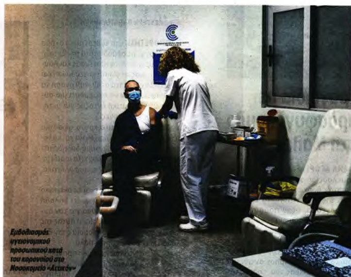
Εμβολιασμός υγειονομικού προσωπικού κατά του κορωνοϊού στο Νοσοκομείο «Αττάλεια»

Ο εμβολιασμός , στον οποίο επένδυσε τα πάντα η ελληνική κυβέρνηση ήδη από το καλοκαίρι, σήμερα συνεχίζεται με ρυθμούς κελώνας και η ανοσία φαίνεται να καθυστερεί δραματικά ● Οι 5.105 εμβολιασμοί την ημέρα βρίσκονται μακριά από τον στόχο των 8.000 ● Αντιφάσεις στα στοιχεία του Εθνικού Επιχειρησιακού Σχεδίου Εμβολιασμού κατά Covid-19