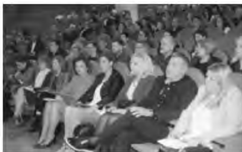
Από τη χθεσινή εκδήλωση για τη γυναίκα στο Πανεπιστήμιο Θεσσαλίας

Φορείς διοργάνωσης το Νομαρχιακό Τμήμα Μαγνησίας της ΑΔΕΔΥ, το Πανεπιστήμιο Θεσσαλίας, τα Γενικά Αρχεία του Κράτους (Γ.Α.Κ.) – Αρχεία Ν. Μαγνησίας και ο Δικηγορικός Σύλλογος Βόλου.