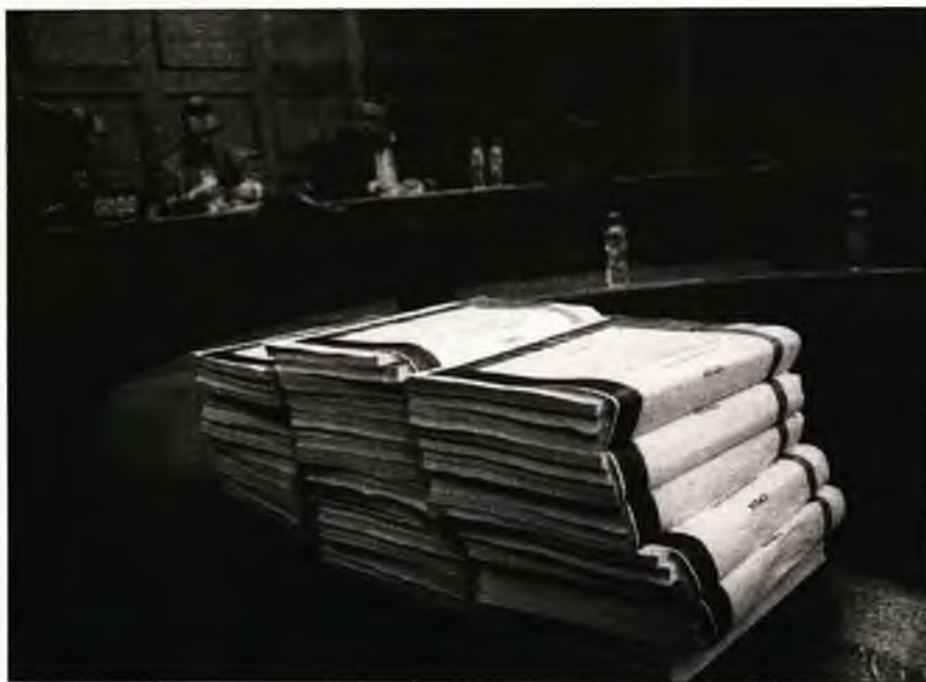
Ολόκληρο το πόρισμα της Εξεταστικής για την Υγεία

Η Δημοκρατική Συμπράταξη και το ΚΚΕ δήλωσαν ότι δεν συμφωνούν με το περιεχόμενο του πορίσματος, ενώ οι εκπρόσωποι του Ποταμιού και της Ένωσης Κεντρώων ψήφισαν «πα-