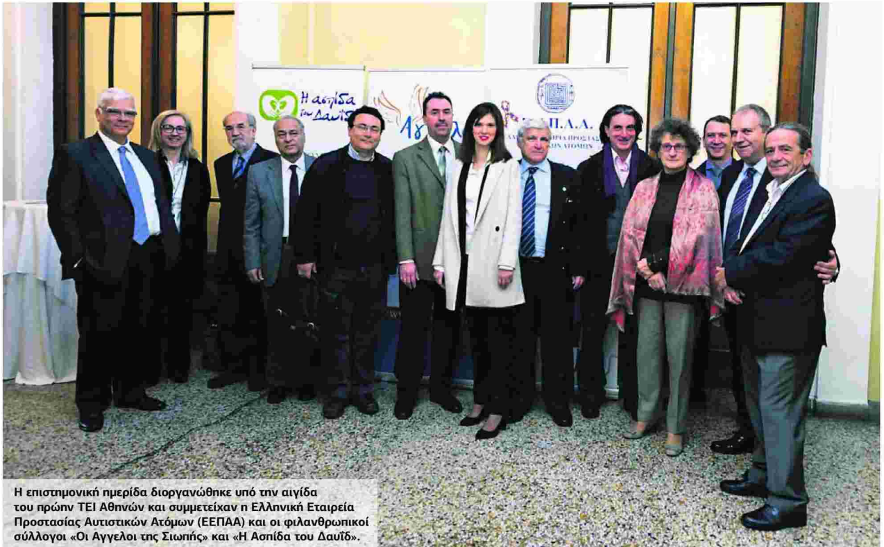
Η επιστημονική ημερίδα διοργανώθηκε υπό την αιγίδα του πρώην ΤΕΙ Αθηνών και συμμετείχαν η Ελληνική Εταιρεία Προστασίας Αυτιστικών Ατόμων (ΕΕΠΑΑ) και οι φιλανθρωπικοί σύλλογοι «Οι Αγγελοι της Σιωπής» και «Η Ασπίδα του Δαυΐδ».

ΟΙ ΝΕΕΣ ΔΟΜΕΣ ΠΑΡΟΥΣΙΑΣΤΗΚΑΝ ΣΕ ΕΠΙΣΤΗΜΟΝΙΚΗ ΗΜΕΡΙΔΑ