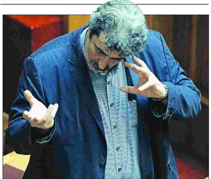
Ο αν. υπουργός Υγείας Παύλος Πολάκης και, κάτω, οι αποκαλύψεις της «δημοκρατίας» για τον διορισμό ενός ιδιοκτήτη συνεργείου μοτοσικλετών, στη θέση του αντιπροέδρου του Νοσοκομείου Σαντορίνης (πορτρέτο κάτω)