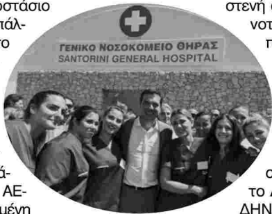
Το Γενικό Νοσοκομείο Σαντορίνης εγκαινιάσε ο πρώτος υπουργός Αλέξης Τσίπρας στις 15 Ιουλίου 2016

Διοικητικός Διευθυντής και Υποδιευθυντής Διοικητικής Υπηρεσίας, προσελήφθησαν, με κομματικά, όπως υποστηρίζεται, κριτήρια, ένας εργαζόμενος με προϋπηρεσία σε εργοστάσιο με λαμπτήρες και ένας υπάλληλος με προϋπηρεσία στο λαδεμπόριο