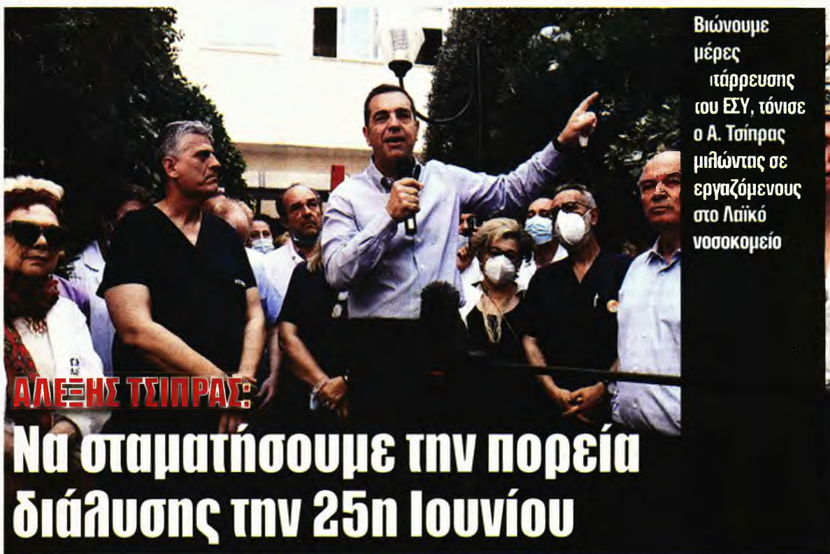
Βιώνουμε μέρες «τάρρευσής του ΕΣΥ, τόνισε ο Α. Τσίπρας μιλώντας σε εργαζόμενους στο Λαϊκό νοσοκομείο

Τόνισε ότι στις 25 Ιουνίου «πρέπει να βάλουμε πάνω τις ζωές μας, τις ανάγκες μας και να σταματήσουμε αυτή την πορεία διάλυσης και κοινωνικής λεηλασίας». Είπε ότι το πρόγραμμα του ΣΥΡΙΖΑ, «απόλυτα ρεαλιστικό, εφαρμόσιμο και κοστολογημένο», «δίνει δύναμη στην κοινωνία και συνοψίζεται στο εξής: αύξηση των μισθών, μείωση των τιμών και ρύθμιση των χρεών, στήριξη της παιδείας, της δημόσιας υγείας, της κοινωνίας». Σε κάθε περίπτωση, σημείωσε, «πόσο κοστίζει η ζωή της 63χρονης και της 19χρονης που χάθηκαν επειδή δεν είχαμε προσωπικό στο ΕΚΑΒ, πόσο κοστίζει η ζωή του εργατή που χάθηκε στο Πέραμα, πόσο κοστίζει η αξιοπρέπεια, η ασφάλεια και η ζωή». Ο πρόεδρος του ΣΥΡΙΖΑ είπε ότι η κάλπη της 25ης Ιουνίου είναι μια νέα κάλπη. Σημείωσε ότι στις προηγούμενες εκλογές της απλής αναλογικής χάθηκε η ιστορική ευκαιρία. «Πέρασε αυτή η περίο-