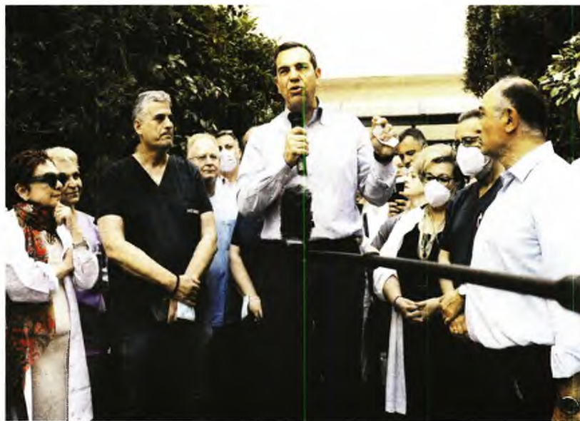
Την τριτοκοσμική εικόνα που παρουσιάζει η Δημόσια Υγεία περιέγραψε ο Τσίπρας σε ομιλία του στο Λαϊκό Νοσοκομείο με αφορμή τα δραματικά περιστατικά σε Κω και Νέα Μάκρη

Τρομακτικά ήταν όσα είπε -για την ακρίβεια, όσα δεν είπε- ο Κυριάκος Μητσοτάκης κατά την επίσημή του στο αντικαρκινικό νοσοκομείο «Άγιος Σάββας», καθώς δεν έκανε ούτε καν μια αναφορά στα τραγικά περιστατικά στην Κω και στη Νέα Μάκρη. Ούτε λέξη δεν είπε για την υποστελέχωση των μονάδων Υγείας, για την έλλειψη υποδομών ή για το ότι τα μισά ασθενοφόρα είναι παρολιμμένα. Αντιθέτως, υποστήριξε πως, παρά τις αδυναμίες, το ΕΣΥ λειτουργεί και υποσχέθηκε την αναβάθμισή του για να δεσμευθεί σε μια γενικολογία ότι το Εθνικό