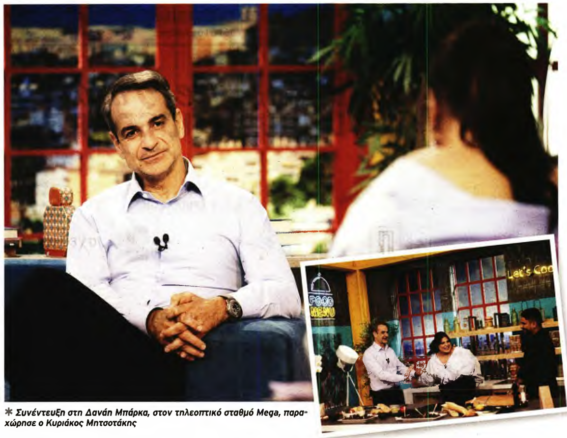
* Συνέντευξη στη Δανάη Μπάρκα, στον τηλεοπτικό σταθμό Mega, παραχώρησε ο Κυριάκος Μητσοτάκης

Σύμμαχος σε αυτήν την ομολογουμένως απαιτητική αποστολή είναι, σύμφωνα με καλά πληροφορημένες πηγές, τα ευρήματα των κυλιόμενων μετρήσεων, που εμφανίζουν τη ΝΔ απ’ ενός να διατηρεί τη δυναμική της, απ’ ετέρου