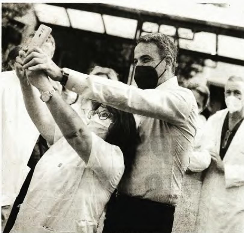
* Από τη χθεσινή επίσκεψη του Κυριάκου Μητσοτάκη στο νοσοκομείο «Άγιος Σάββας»

Πάντως, ο Κυριάκος Μητσοτάκης, απαντώντας στη Δανάη Μπάρκα για την επιτυχία που έχει η εμφάνισή του στην κινεζική πλατφόρμα TikTok, δήλωσε: «Δεν είναι η νέα μου εικόνα. Το TikTok έδειξε ποιος είμαι πραγματικά, έτσι είμαι. Στην τηλεόραση με βλέπετε με γραβάτα. Το TikTok αφορά πρωτίστως τη νεολαία, αλλά δεν είναι μόνο θέμα εικόνας. Οι νέοι δεν μας ψήφισαν μόνο λόγω TikTok, αλλά γιατί μιλούσαμε για τα θέματα που τους αφορούν. Το χαίρομαι πολύ το TikTok και μου δίνει τη δυνατότητα να αυτοαρκάζομαι, να κάνω λίγες πλάκες, να παίρνω με αυτό τον τρόπο ένα κομμάτι της έντασης της δουλειάς», κατέληξε.